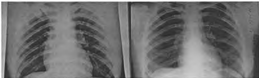
Рис. 3. Рентгенограммы органов грудной клетки через 1 сутки и перед выпиской.

Второе наблюдение – ребенок Милослава С., 2 года, наблюдалась педиатрами по поводу релаксации правого купола диафрагмы, частыми ОРЗ. После