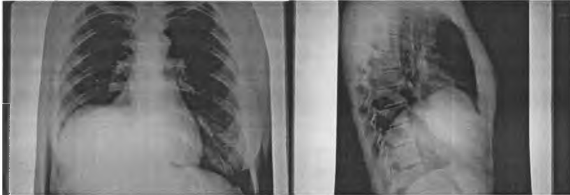
Рис. 1. Рентгенограммы органов грудной клетки ребенка Алены В. 15 лет до обследования

гическое заключение: образование примерно 12 см в диаметре, с плотными стенками, на разрезе встречаются хрящевые ткани, фиброзная стенка кисты частично без выстилки, частично выстлана многослойным эпителием, отдельные железы, плотное бесструктурное содержимое. Осмотрена через год – жалоб нет, рентгенограмма органов грудной клетки без патологии, косметический результат хороший.